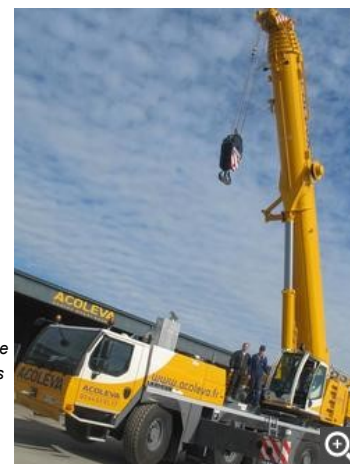
Francisque Fontenille, le chargé de développement de l'entreprise, et Christian, un des chauffeurs, paraissent bien petits à côté de la nouvelle grue mobile d'Acoleva.

« Elle permet de travailler à l'intérieur des bâtiments, en passant dans des espaces exigus et on l'utilise pour des déplacements industriels, des entreprises qui déménagent... », décrypte Francisque Fontenille. On intervient aussi pour des opérations plus basiques qui nécessitent des précautions particulières : déplacements de coffres-forts, de serveurs informatiques... ». Sans oublier les convois exceptionnels.